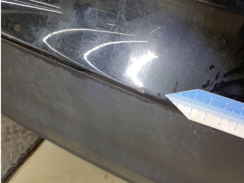
Stoßfänger: Stoßfänger hinten - Kratzer - lackieren