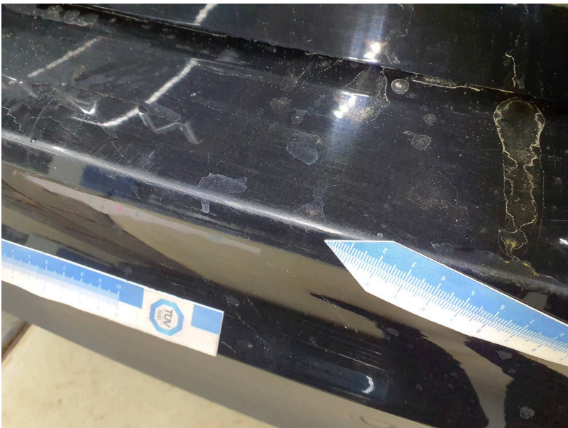
Stoßfänger: Stoßfänger hinten - Kratzer - lackieren