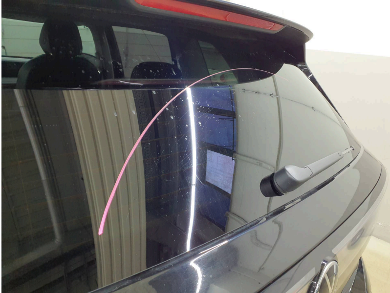
Verglasung: Heckscheibe - Kratzer - erneuern