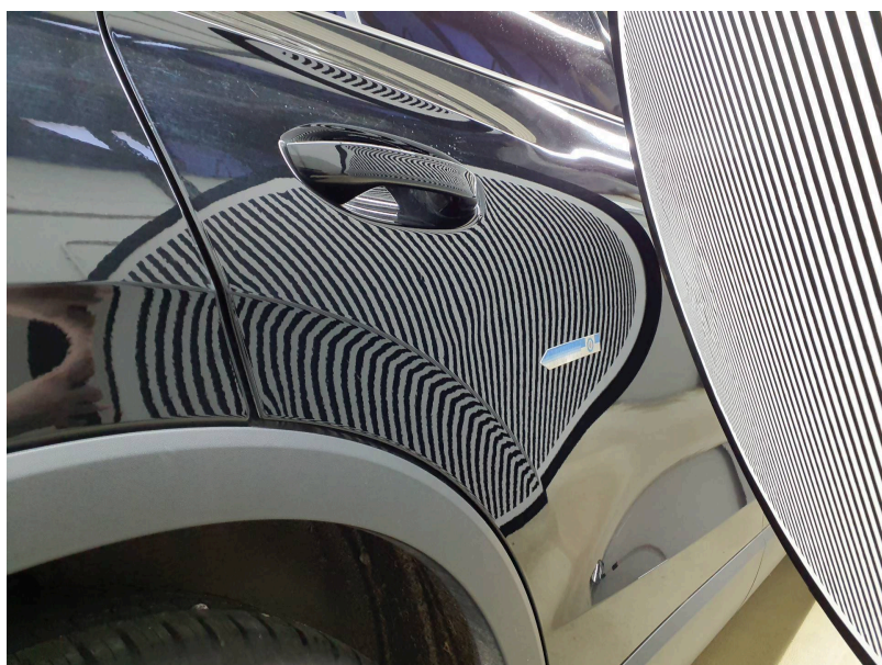
Tür außen: Tür hinten rechts - Deformation - instandsetzen und lackieren