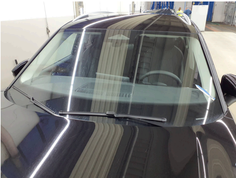
Frontscheibe: Frontscheibe - Steinschlag - erneuern