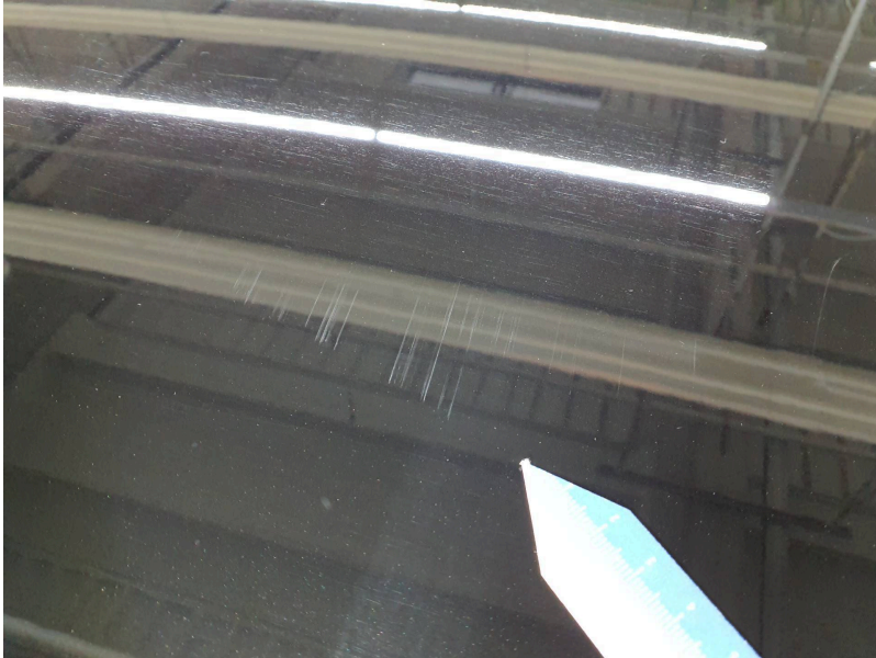
Dach: Dach / Verdeck - Kratzer - lackieren