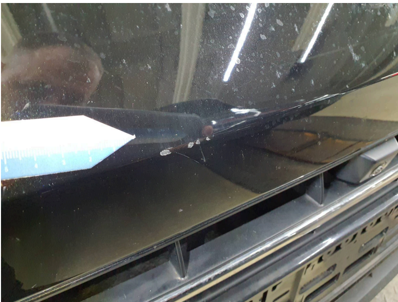
Stoßfänger vorn: Stoßstange vorn - Kratzer - lackieren