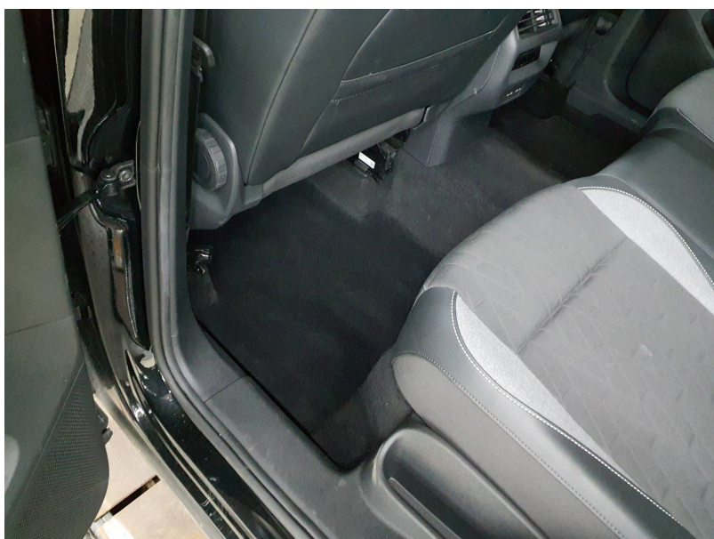
Zubehör / Fehlteile: Fußmatten hinten - fehlt - erneuern