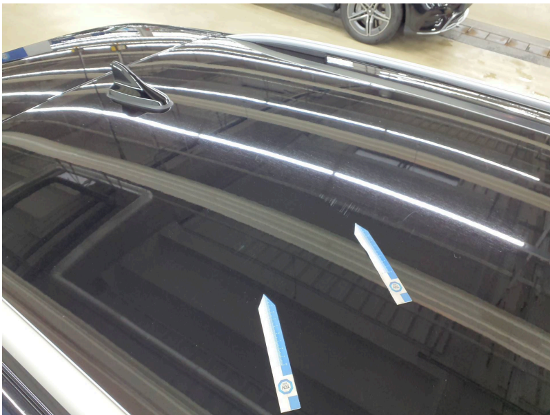
Dach: Dach / Verdeck - Kratzer - lackieren