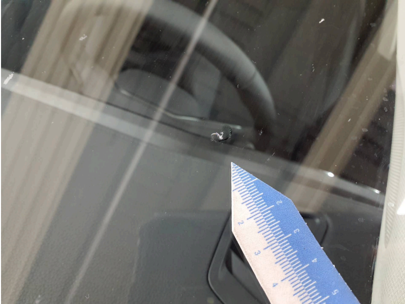
Frontscheibe: Frontscheibe - Steinschlag - erneuern