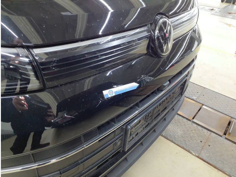
Stoßfänger vorn: Stoßstange vorn - Kratzer - lackieren