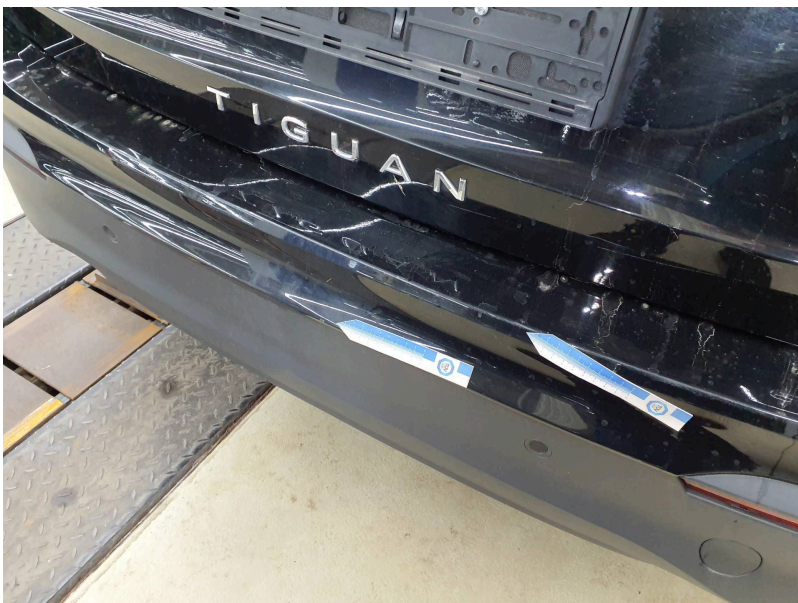
Stoßfänger: Stoßfänger hinten - Kratzer - lackieren