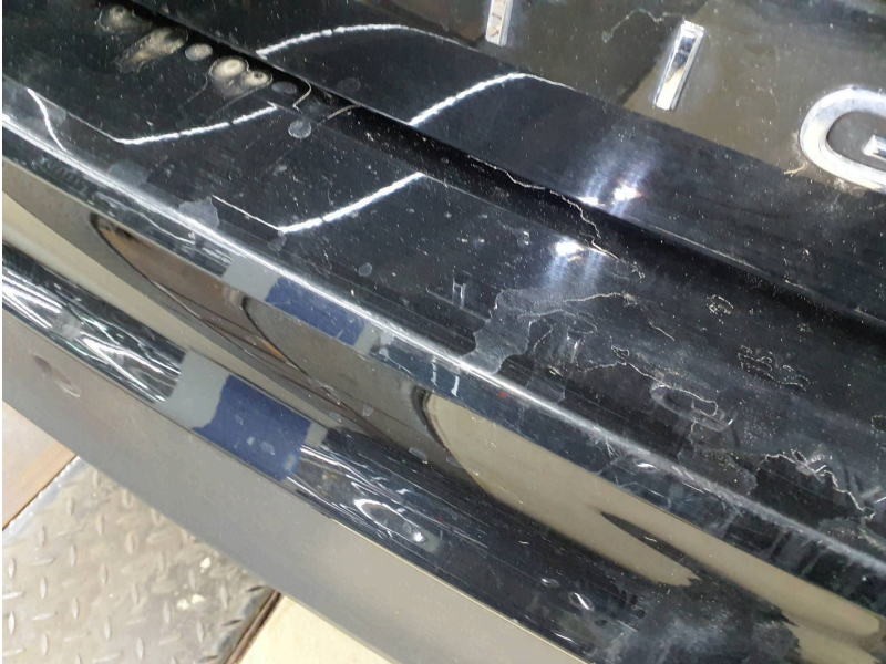
Stoßfänger: Stoßfänger hinten - Kratzer - lackieren