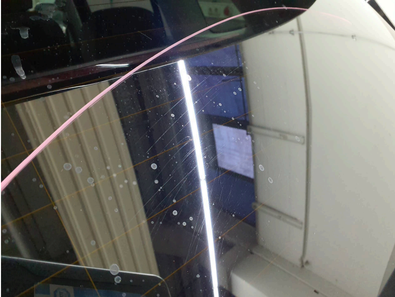
Verglasung: Heckscheibe - Kratzer - erneuern