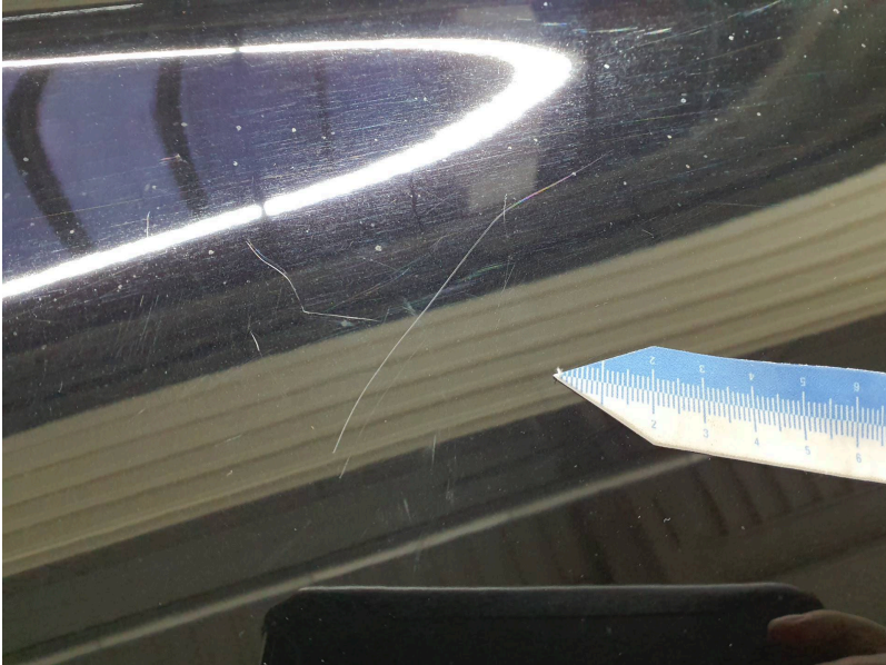
Motorhaube: Haube vorn - Kratzer - lackieren