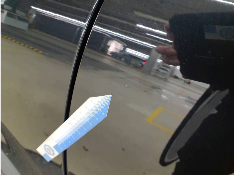
Tür außen: Tür vorne links - Kratzer - auslegen / polieren