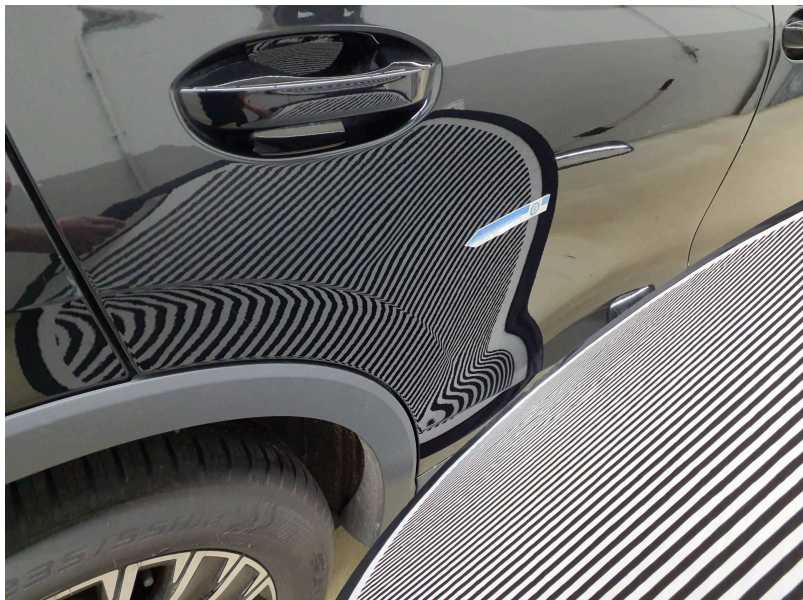
Tür außen: Tür hinten rechts - Deformation - instandsetzen und lackieren