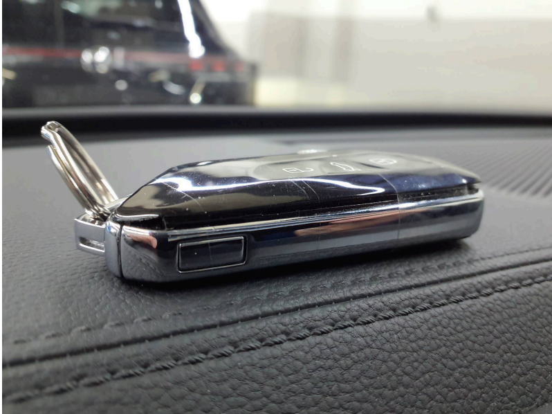
Zubehör / Fehlteile: Fzg.-Schlüssel m. Fernbedienung - beschädigt - erneuern