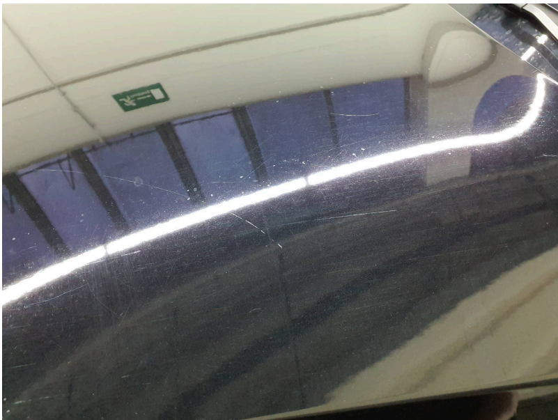
Motorhaube: Haube vorn - Kratzer - lackieren