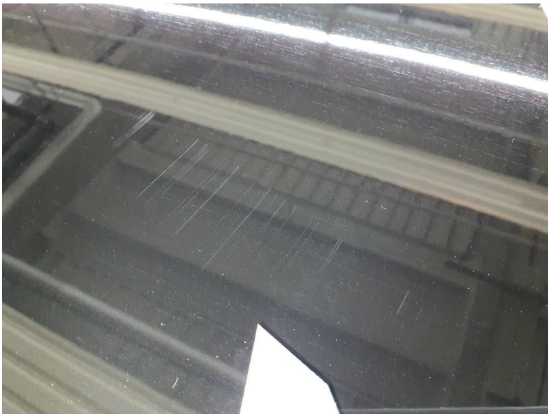
Dach: Dach / Verdeck - Kratzer - lackieren