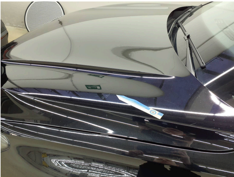
Motorhaube: Haube vorn - Kratzer - lackieren